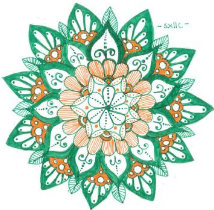
Tekening: Salima (v5)